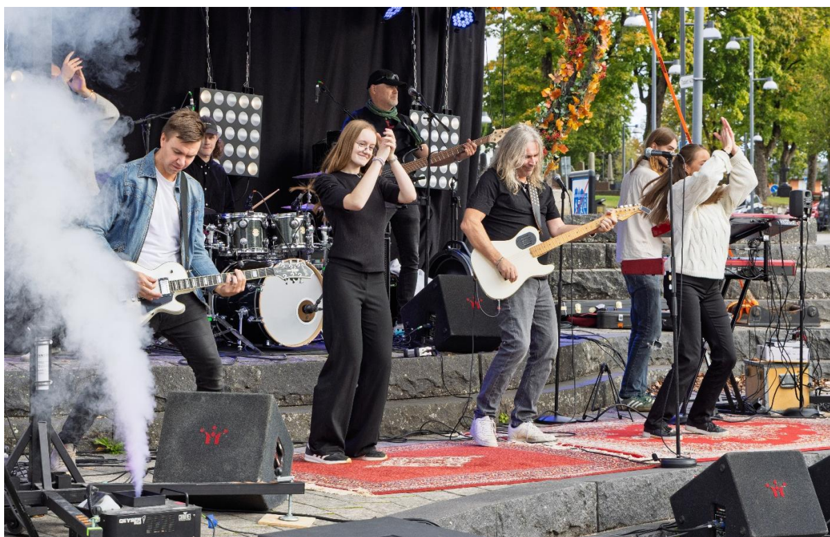
Rykande aktuella Youngsters på Sättraplan