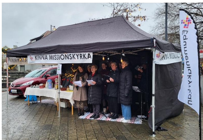
Kören på Sättraplan 1:a advent