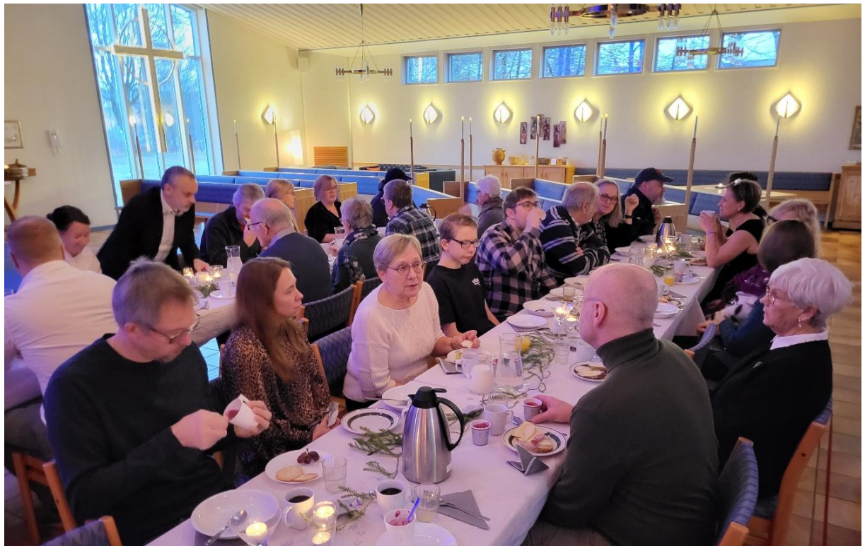
Festlig nyårsfrukost i kyrkan