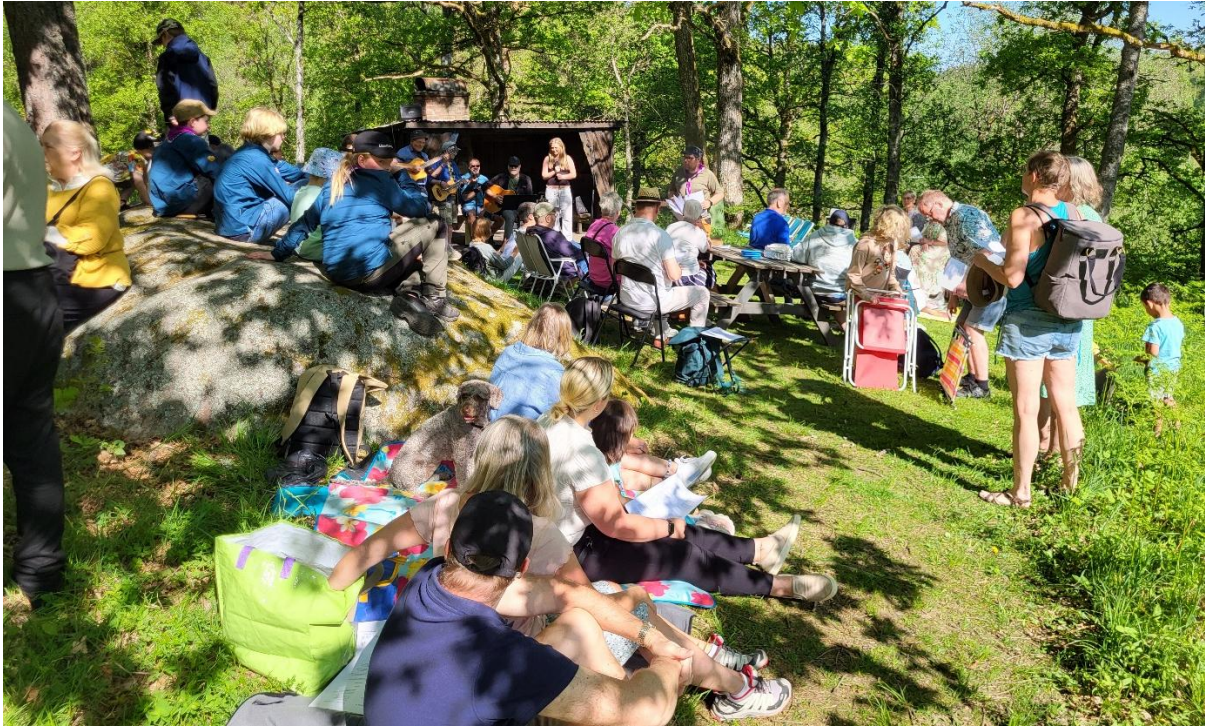
Tillsammans med scouterna i Mariebergsparken - Tweenies i kyrkan