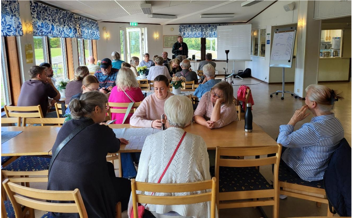
Församlingsdag på Råddehult