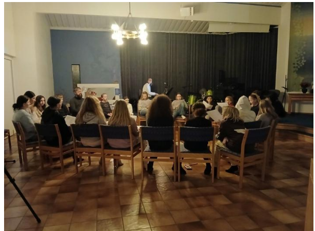
Scouter vid Mjögasjön – Familjegudstjänst i juletid – Messy Church i advent