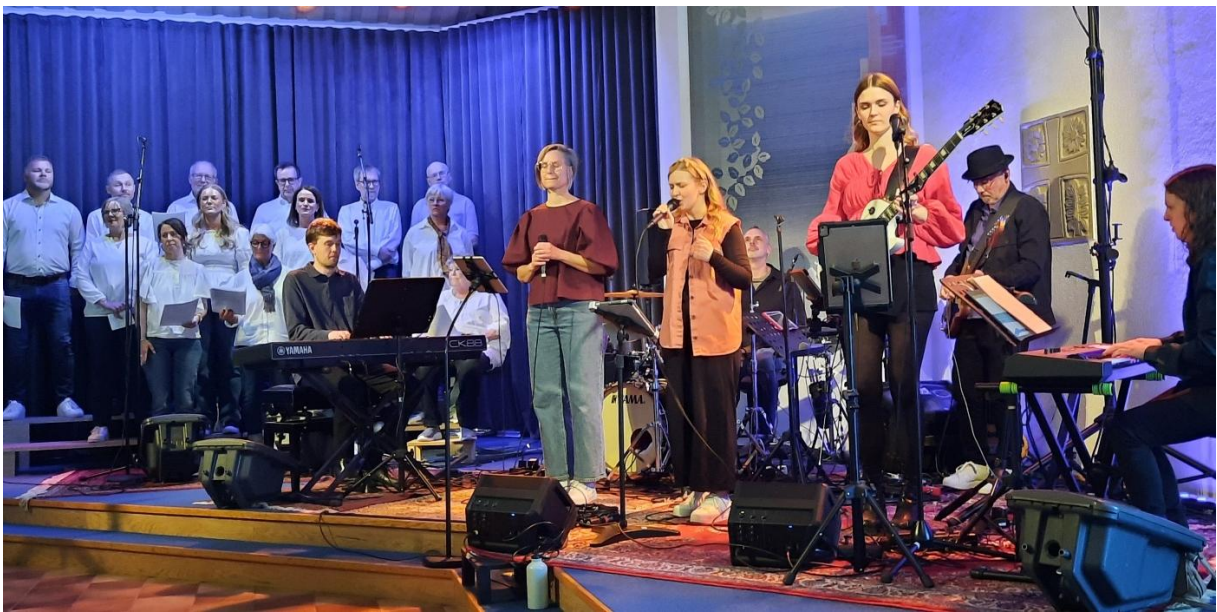
Known och kören i konsert med fullsatt kyrka